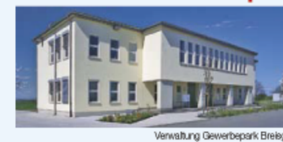
Verwaltung Gewerbepark Breisgau